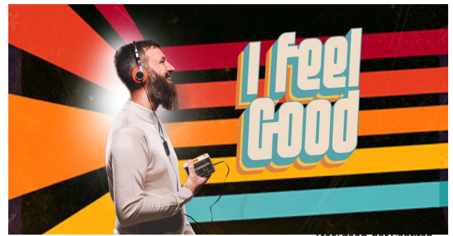
I feel good, par Sapritch